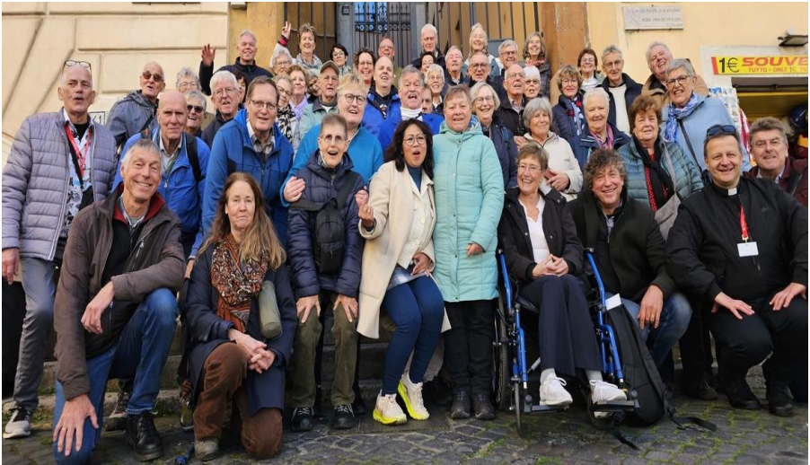
De hele groep bij elkaar

Donderdag. Afscheid/bedank viering in de kapel van het hotel. De bus in met een lunchpakket op naar het vliegveld en naar huis. Na een goede vlucht, met gezang over tante Gre, kwamen we in Langedijk aan bij onze kathedraal met wind en regen. Moe maar voldaan.